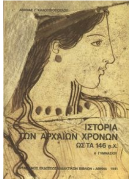
Εικόνα 1. Το εξώφυλλο του βιβλίου «Ιστορία των Αρχαίων Χρόνων»

Τελικά ο υπουργός Παιδείας Αλλαμανής υπογράφει διαταγή να διατεθούν όλα τα βιβλία εκτός του βιβλίου των Θρησκευτικών 1 .