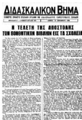
Εικόνα 2. Η σχετική σελίδα από το Διδασκαλικό Βήμα

κ. Στ. Παττακός, ο Υπουργός Εθν. Παιδείας κ. Θ. Παπακωνσταντίνου, ο Γενικός Γραμματεύς του Υπουργείου Εθν. Παιδείας κ. Ν. Γαλιδάκης, ο Πρόεδρος της Ακαδημίας Αθηνών κ. Σκάσης, ο Πρύτανης του Παν/μίου Αθηνών κ. Κορρές, το Ανώτατον Εκπ/κόν Συμβούλιον, αντιπροσωπεία Στρατού, οι Διοικήσεις της ΟΛΜΕ και της ΔΟΕ, η Διοίκηση της Ανωτάτης Ομοσπονδίας Γονέων των μαθητών, των Σχολείων πολλοί Καθηγηταί και Διδάσκαλοι και πλήθος λαού, το οποίον υπέδεχθη μετ' ενθουσιασμού τους επισήμους» (Διδασκαλικόν Βήμα, 1968: 10-10, 638, 1-2).