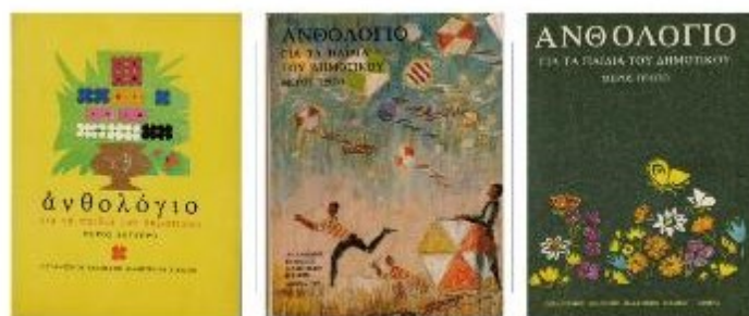
Εικόνα 5. Τα εξώφυλλα των Ανθολογίων

Το 1977 προκηρύσσεται διαγωνισμός για τη συγγραφή νέων αναγνωστικών (ΦΕΚ 1269/26-11-1977). Τα νέα αναγνωστικά ακολουθούν τις προδιαγραφές που είχαν δοθεί με την προκήρυξη, σύμφωνα με την οποία το περιεχόμενό τους έπρεπε να αναφέρεται στην οικογενειακή, τη θρησκευτική, την εθνική, την πολιτιστική και οικονομική ζωή, όπως διαμορφώθηκαν αυτές μέσα στους αιώνες στη σύγχρονη κοινωνία. Η προκήρυξη του 1977 δίνει προτεραιότητα στη διανοητική και συναισθηματική ανάπτυξη των μαθητών/τριών και στην καλλιέργεια του καλαισθητικού συναισθήματος 7 . Νέα αναγνωστικά εκδίδονται το 1979 και 1980. Με πρωτοβουλία του υπουργού παιδείας Νικολάου Λούρου εκδίδεται ακόμα ένα τρίτομο Ανθολόγιο 8 .