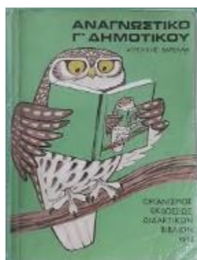
Εικόνα 4. Το εξώφυλλο του Αναγνωστικού Γ' τάξης της Αγγελικής Βαρελά

Με βάση τις εισηγήσεις των επιτροπών αυτών αντικαθίστανται ήδη από τη σχολική χρονιά 1974-5 τα αναγνωστικά του δημοτικού που ήταν γραμμένα στην καθαρεύουσα. Προσωρινά επανέρχονται για τις δύο πρώτες τάξεις τα βιβλία του 1954, για τις τρεις τελευταίες τάξεις τα αναγνωστικά του 1965 και για τη Γ' Δημοτικού « Τα Ψηλά Βουνά » του Ζ. Παπαντωνίου ενώ από το σχολικό έτος 1975-76 μπαίνει στη θέση του το αναγνωστικό της Αγγελικής Βαρελά. Για τις υπόλοιπες τάξεις χρησιμοποιούνται τα αναγνωστικά του 1965 που και αυτά ήταν βελτιωμένη παραλλαγή των αναγνωστικών του 1954 6 . Τα αναγνωστικά αυτά με τις αλλεπάλληλες τροποποιήσεις τις οποίες υπέστησαν κατέληξαν να γίνουν αγνώριστα σε σχέση με την πρώτη τους μορφή.