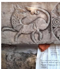
Εικόνα 4. Ο γρίφος και το όστρακο με το προσβλητικό σχόλιο ΕφΑ πόλης Αθηνων (ΥΠΠΟ ΟΔΑΠ)