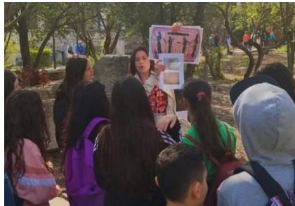
Εικόνα 6. Συζητώντας για τις καθημερινές ασχολίες των γυναικών στην Αρχαία Αθήνα Εφα πόλης Αθηνών (ΥΠΠΟ ΟΔΑΠ), προσωπικό αρχείο Μ.Α. Ιωσηφίδου

Τα παιδιά συνεχίζουν την περιήγησή τους για να βρουν το σπίτι της Σικέλας. Εκεί ανακαλύπτουν έναν αργαλιό και ένα αλφάβητο χαραγμένο πάνω σε ένα από τα υφαντικά βάρη που κρατούν τα σημόνια τεντωμένα. Μέσα από την επίσκεψη στο σπίτι της Σικέλας τα παιδιά γνωρίζουν για τις γειτονιές της Αρχαίας Αθήνας, τα σπίτια της και τη διαρρύθμισή τους. Η αγνύθα δίνει την αφορμή να συζητήσουμε για τη ζωή και τις ασχολίες των γυναικών μέσα στο σπίτι, ενώ το χαραγμένο αλφαβητάρι οδηγεί την κουβέντα στην εκπαίδευση των αγοριών και των κοριτσιών στην Αρχαία Αθήνα.