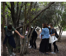
Εικόνα 1. Ανακαλύπτοντας όστρακα με αρχαία γραφήματα Εφα πόλης Αθηνών (ΥΠΠΟ ΟΔΑΠ)

Η διαμόρφωση του προγράμματος βασίστηκε σε συμμετοχικές και βιωματικές μεθόδους. Τα παιδιά προσλαμβάνουν τις γνώσεις μέσω της πράξης και της εμπειρίας (learning by doing) (Corbishley & Stone, 1994; Hein, 2004; Falk & Dierking, 2012). Οι εμπυχωτές ενθαρρύνουν τα παιδιά, σύμφωνα με την παιδαγωγική του ελεύθερου χρόνου (Ambrose, 1993; Falk, 2016), να «ανακαλύψουν» τη γνώση μέσα από την περιήγηση στο αρχαιολογικό χώρο και τη συζήτηση. Αν και οι δράσεις συνδέονται με το Αναλυτικό Πρόγραμμα Σπουδών, τα παιδιά δεν υφίστανται την πίεση της επίδοσης και της επιτυχίας που επιβάλλει το σχολικό περιβάλλον. Η συμμετοχή τους στο πρόγραμμα βασίζεται στην κριτική τους ικανότητα και οι απαντήσεις τους στις ερωτήσεις των εμπυχωτών προκύπτουν αβίαστα, καθώς, μέσω της μαιευτικής μεθόδου, ανελκύονται στην επιφάνεια γνώσεις που ήδη υπάρχουν (Νικονάνου, 2010; Banzi, 2022). Οι μαθητές συμμετέχουν ενεργά με ψυχαγωγικούς και ευφάνταστους τρόπους, όπως η εξερεύνηση, η ανακάλυψη, ο διάλογος και η δραματοποίηση (Hughes, Jackson & Kidd, 1998). Κεντρικό εκπαιδευτικό εργαλείο του προγράμματος είναι η ανακαλυπτική μέθοδος, με την επίλυση γρίφων, την εξερεύνηση και την ανακάλυψη κρυμμένων οστράκων. Ίσως, το πιο σημαντικό είναι ότι δημιουργείται ένα περιβάλλον συνεργασίας, μέσα στο οποίο τα παιδιά αλληλοεπιδρούν μεταξύ τους και με τον εμπυχωτή (Καλεσσοπούλου, 2014).