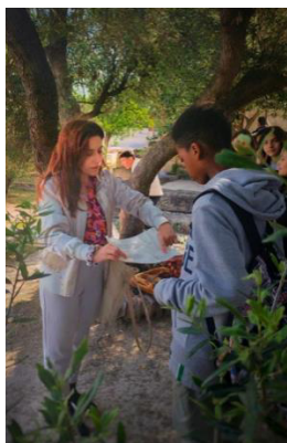
Εικόνα 8. Λύνοντας τους γρίφους Εφα πόλης Αθηνών (ΥΠΠΟ ΟΔΑΠ)

τον στόχο του και ευελπιστούμε ότι τα παιδιά μεγαλώνοντας θα προστατεύουν, θα σέβονται και θα διαφυλάσσουν την πολιτιστική μας κληρονομιά. Συνεπώς, μπορούμε να αισιοδοξούμε ότι τα μνημεία και τα αρχαία γκράφιτι θα συνεχίσουν να ψιθυρίζουν και στις επερχόμενες γενιές τις ιστορίες τους.