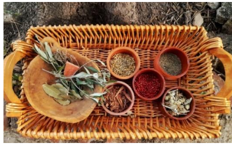
Εικόνα 3. Ο πάγκος της Σικέλας και το κρυμμένο όστρακο Εφα πόλης Αθηνών (ΥΠΠΟ ΟΔΑΠ)

Στην ιστορία μας η Σικέλα έχει έναν πάγκο στην αρχαία αγορά και πουλάει βότανα, αρώματα και γιατροσόφια. Τα παιδιά πρέπει να εντοπίσουν τον πάγκο της και να ανακαλύψουν ένα όστρακο με το γιατροσόφι για το τσίμπημα από έναν σκορπιό. Τα παιδιά περιεργάζονται τηνπραμάτεια της Σικέλας και μαθαίνουν για τα βότανα αλλά και για την ιατρική στην αρχαιότητα. Ακούνε για τον θεό της ιατρικής τον Ασκληπιό αλλά και για τον «πατέρα» της επιστήμης αυτής τον Ιπποκράτη. Επιπλέον, μαθαίνουν για τη λειτουργία της αγοράς ως εμπορικό κέντρο και τη θέση της γυναίκας σε αυτό. Αναρωπιούνται πώς γίνεται η Σικέλα, μία γυναίκα, να έχει ρόλο εμπόρισσας σε μία εποχή οπου το πεδίο δραστηριότητας των γυναικών ήταν κατά βάση η οικία. Ανακαλύπτουν, μέσα από τη συζήτηση, ότι η Σικέλα ήταν μέτοικος με καταγωγή από τη Σικελία και ανακαλούν στη μνήμη τους όσα έχουν διδαχθεί για τους μετοίκους στην Αρχαία Αθήνα. Καταλαβαίνουν, μέσα και από τις μαθητικές τους γνώσεις, ότι μία μέτοικος μπορούσε να ασκεί εμπορικές δραστηριότητες παρά το γεγονός ότι ήταν γυναίκα.