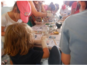
Εικόνα 7. Το εργαστήριο συντήρησης ΕφΑ πόλης Αθηνών (ΥΠΠΟ ΟΔΑΠ)

Στο δεύτερο μέρος του προγράμματος, ανεβαίνουμε στη στοά του Αττάλου για μία σύντομη παρουσίαση power point ή ένα βιωματικό εργαστήριο συντήρησης. Η παρουσίαση βασίζεται σε ερωτο-αποκρίσεις και στην ενεργό συμμετοχή των μαθητών και των μαθητριών. Ξεκινάμε, ανιχνεύοντας την ιστορία του αρχαίου γκράφιτι από την προϊστορία μέχρι τους νεότερους χρόνους. Τα παιδιά καλούνται να σκεφτούν τους παράγοντες που φθείρουν το αρχαίο γκράφιτι αλλά και τρόπους με τους οποίους μπορούμε να το διασώσουμε. Στο δεύτερο μέρος της παρουσίασης, μέσα από τις εικόνες που προβάλλονται, τα παιδιά κατανοούν ότι ο καθαρισμός των μνημείων από τα σύγχρονα γκράφιτι είναι μία χρονοβόρα διαδικασία με επαχθές χρηματικό και περιβαλλοντικό κόστος. Φυσικά, το σύγχρονο γκράφιτι δεν προσεγγίζεται με έναν μονοσήμαντο τρόπο αλλά αναγνωρίζεται η αξία του ως μορφή τέχνης, όταν γίνεται με συναίνεση. Τέλος, τα παιδιά γνωρίζουν το θεσμικό πλαίσιο γύρω από το αρχαίο αλλά και σύγχρονο γκράφιτι. Εναλλακτικά, το πρόγραμμα ολοκληρώνεται με ένα βιωματικό παιχνίδι καθαρισμού, όπου οι μαθητές/τριες καθαρίζουν μικρές επιφάνειες μαρμάρου που έχουν προσβληθεί από γκράφιτι και καταγράφουν τα συμπεράσματά τους. Με τον τρόπο αυτό, ρίχνουν μία κλεφτή ματιά στον κόσμο των συντηρητών αρχαιοτήτων.