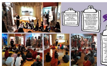
Εικόνα 6. Παίζοντας με αινίγματα και γρίφους, μιλούμε για τη σημειωτική λειτουργία της παραδοσιακής φορεσιάς