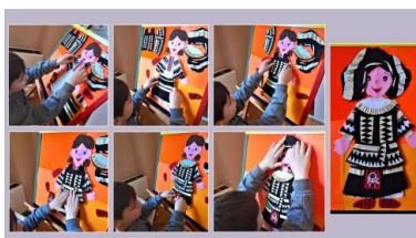
Εικόνα 4. Ντύνοντας το κορίτσι