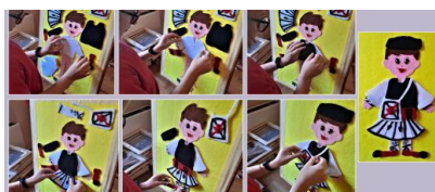
Εικόνα 5. Ντύνοντας το αγόρι