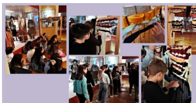
Εικόνα 2. Υφαινόντας στον όρθιο επιδαπέδιο αργαλειό του Μουσείου