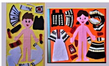
Εικόνα 3. Ανακαλύπτοντας τη μορφολογία της παραδοσιακής ενδυμασίας μέσα από το ντύσιμο δυο υφασμάτων κουκλών, ενός μικρού Σαρακατσάνου και μιας μικρής Σαρακατσάνας